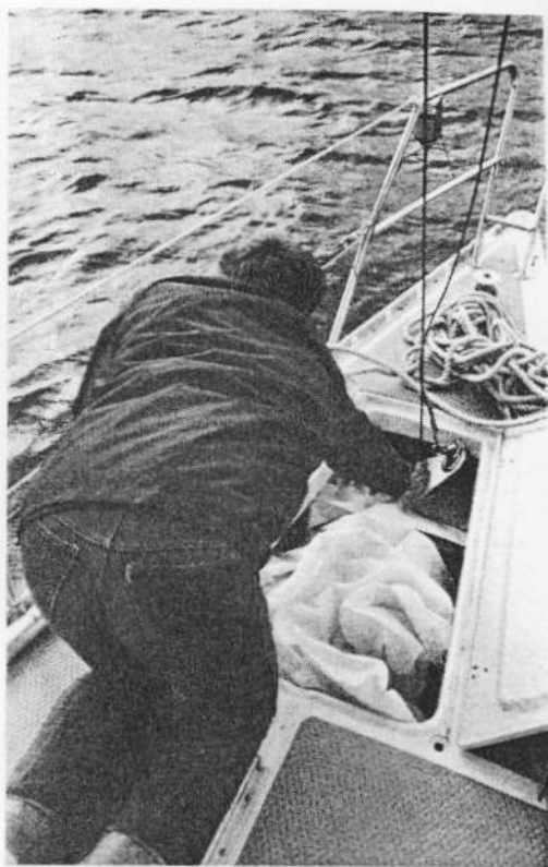
En solid luke forut sluker hele forseilet. Stagene går gjennom lukene slik at man slipper å huke av staggrokkene for å stue seilet. På denne måten er det unna veien, og alltid klart til å heises.