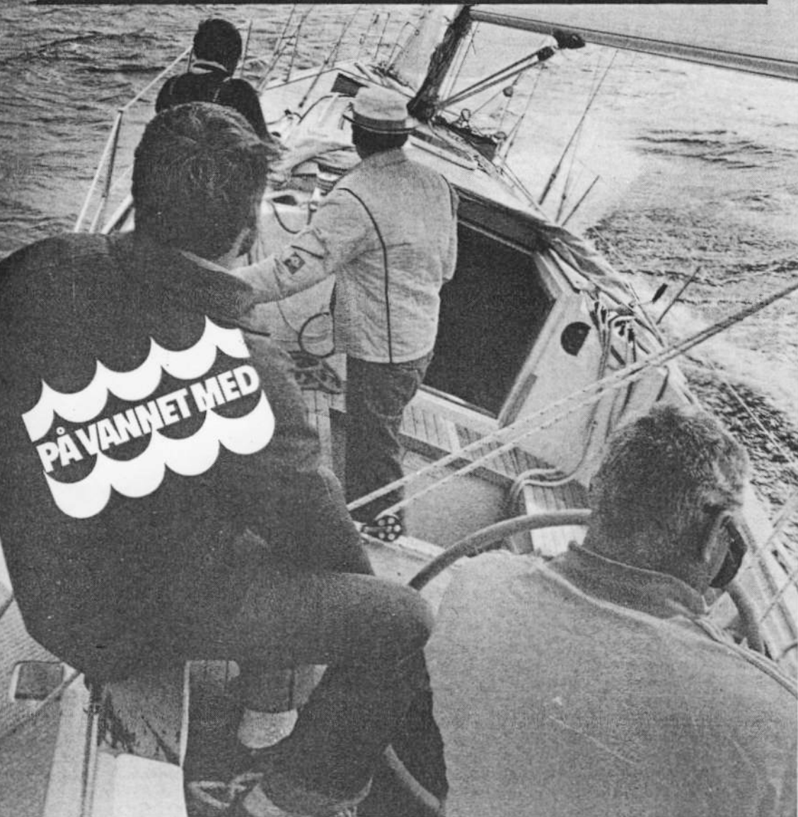
Et «utsnitt» av båten, for full duk gjennom Stockholm-skjærgården, der båten til fulle demonstrerte sin manøvreringsevne.